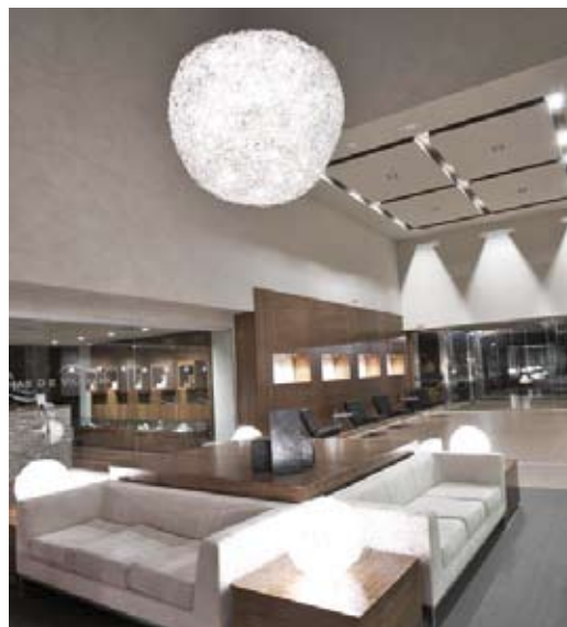
Cada espacio está esmeradamente decorado. ADC

ca más de 2.500 metros cuadrados a la cultura del agua. Distribuido en dos áreas, dispone de una termolúdica y de otra específica para tratamientos, que están abiertas al público durante todo el año. La primera acoge un Club Termal para adultos y otro infantil, para niños de hasta ocho años; y tiene también un Circuito Termal. Además, cuenta con zonas VIP para los más exigentes. A mayores, dispone de un completo gimnasio, dotado del último equipamiento de cardio-fitness y de un área de estética con tecnología de última generación. En él se ofrecen también tratamientos de alta cosmética natural Balnea.