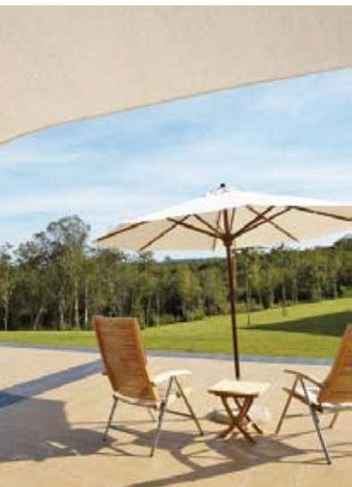
Cuenta con áreas que aúnan confortabilidad y belleza. ADC