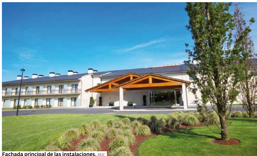
Fachada principal de las instalaciones. ADC

De éstas también pueden disfrutar contrayentes e invitados, dado que el hotel ofrece todo tipo de servicios y tratamientos. Disfrutar de unos días de dicho entorno propicia vivir aún mejor la ceremonia. Para favorecerlo, el establecimiento cuenta con su área Spa Termas de Villalba, en la que dedi-